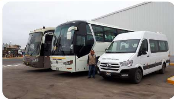
TRANSPORTE DE PERSONAL