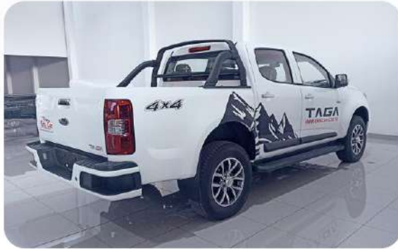
TRANSPORTE DE CARGA